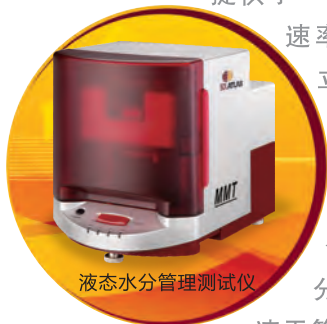
液态水管理测试仪

也可以与锡莱亚太拉斯的液态水管理测试仪(MMT)配合使用，以便全面了解功能织物的液态水管理特性(吸湿、排汗、速干等)。